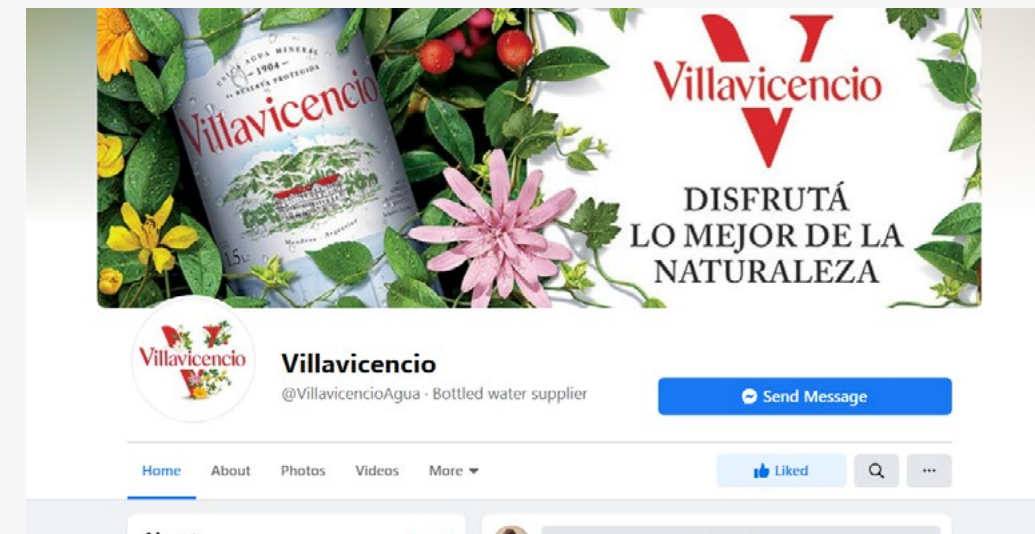
VILLAVICENCIO Facebook fan page